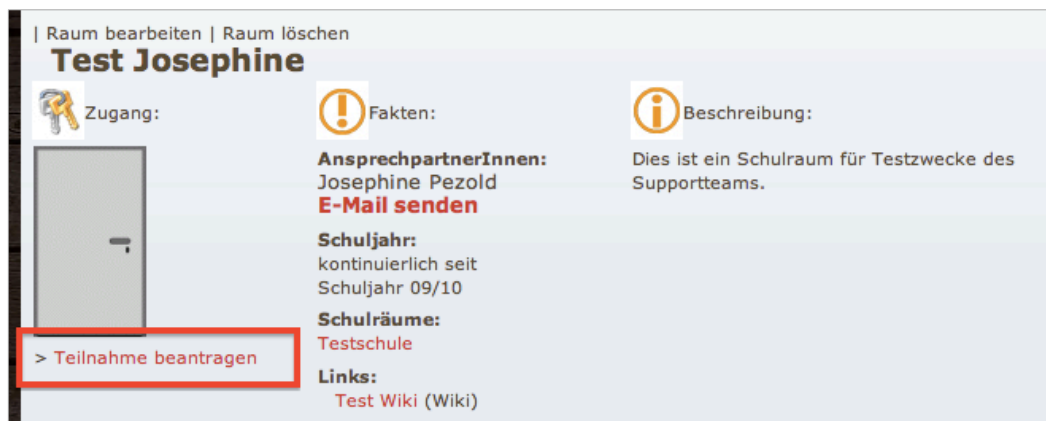
Abb. 3: Teilnahme beantragen